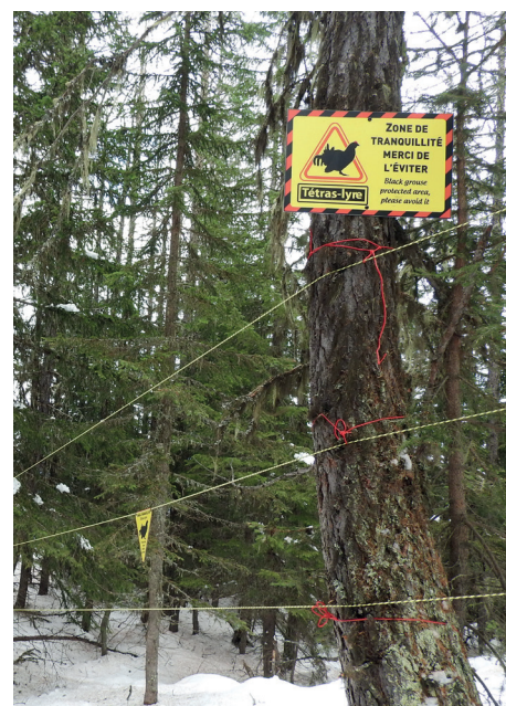
PNV - S. Berthillot

Les données détenues par chacun, présence des oiseaux et fréquentation des pratiquants de sports d'hiver, ont permis de définir les zones-clés où prévenir les dérangements. Cela représente une superficie entre 2000 m 2 et 2 ha. Piquets, cordes élastiques et fanions pour la dissuasion ; panneaux d'information pour la sensibilisation. Reste à suivre sur trois ans les traces d'intrusion et la présence des tétras-lyres via leurs crottiers pour juger du dispositif en vue de son amélioration au fil des saisons.