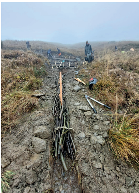
PNV - J-F. Deroussin