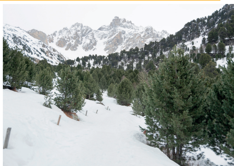
PNV - F. Maurer