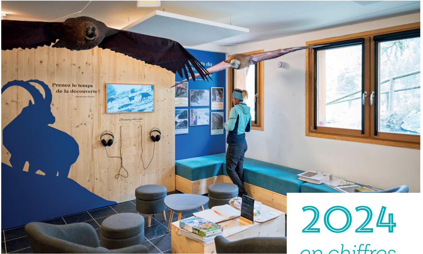
PNV - F. Maurer