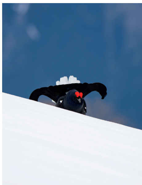
PNV - T. Faivre