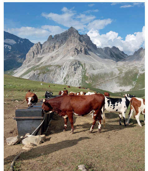
PNV - C. Rogeaux