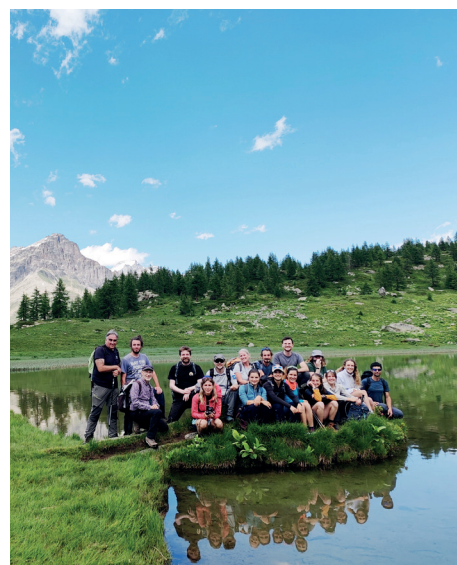
Parc national du Grand Paradis - A. Mainetti

L'analyse de données météorologiques et d'images satellite permettra de déterminer chaque année, dans un secteur donné, le stock d'eau disponible sous forme solide (neige et glace) à la sortie de l'hiver. Cette donnée est désormais essentielle compte tenu de la vulnérabilité de certains sites à la sécheresse estivale et du soutien des eaux de fonte au débit des ruisseaux et des sources d'altitude. D'autres actions aideront les agriculteurs confrontés à une baisse de la ressource en eau : diagnostics pastoraux, financement de travaux préconisés, accompagnement dans des choix techniques, guide et vidéos illustrant de bonnes pratiques.