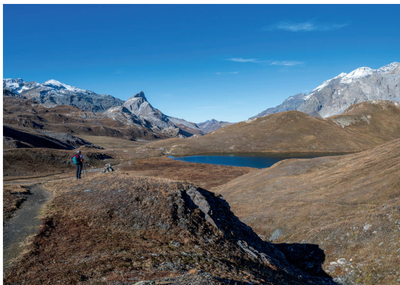
PNV - F. Maurer