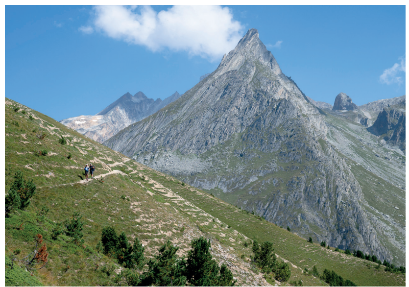
PNV - F. Maurer