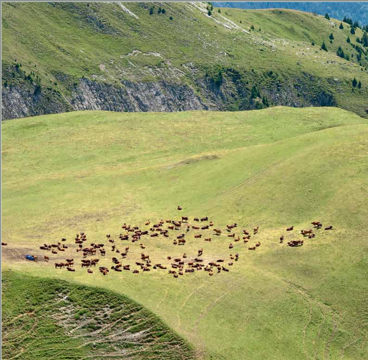
Vaches en pâture près de la chapelle de Bozelet (Bozel)