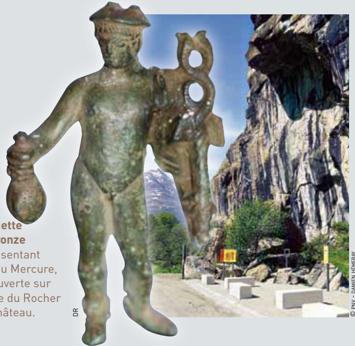
Statuette en bronze représentant le dieu Mercure, découverte sur le site du Rocher du Château.