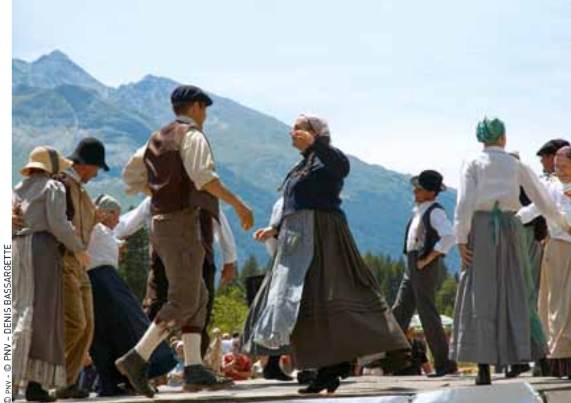
© PNV - © DENIS BASSARGETTE

Dictionnaire étymologique des noms de lieux de la Savoie d'Adolphe Gros, éditions La Fontaine de Siloé, 1994.