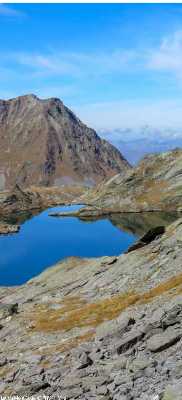
Lac du Mont-Coua.

Comment pêcher ? > Une seule ligne montée sur canne, munie de 2 hameçons au plus ou de 3 mouches artificielles au plus sans ardillons (pour ne pas blesser les prises). > L'épuisette est autorisée uniquement pour retirer de l'eau un poisson déjà ferre. Sont interdits : > la pêche à l'aide de poisson vif ou mort (pour éviter l'introduction d'espèces, d'individus ou de maladies dans le milieu) ; > l'amorçage (pour éviter l'apport d'intrants, sources possibles de perturbation du milieu) y compris avec : > Des oeufs de poissons, naturels, frais, de conserve ou mélangés à une composition d'appâts ou artificiels ; > Des asticots ou larves de diptères ; > Des drogues ou appâts en vue d'enivrer le poisson ou de le détruire ; > la pêche en barque ou tout autre moyen flottant ; > la pêche sous glace et en troublant l'eau ; > de placer un ouvrage pour empêcher le passage du poisson ou le retenir captif ; > la commercialisation du poisson ;