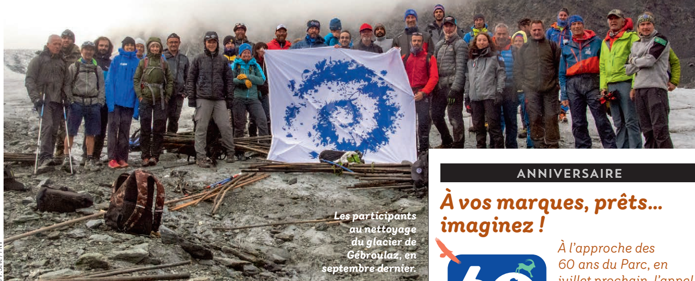
Les participants au nettoyage du glacier de Gébroulaz, en septembre dernier.